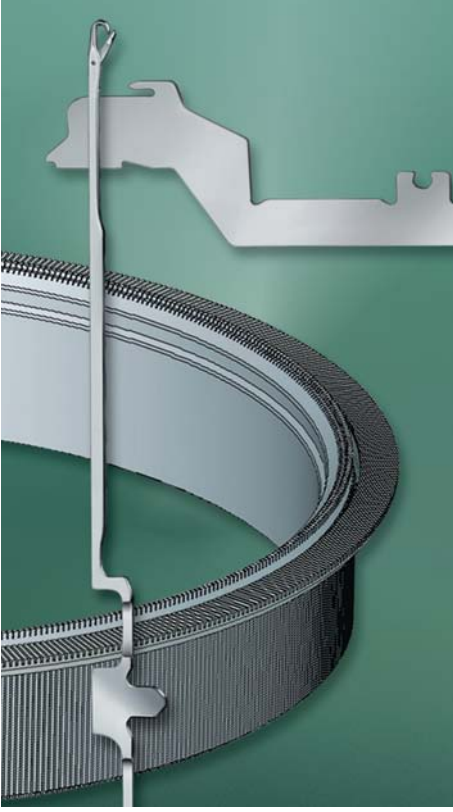
GROZ-BECKERT'İN BENZERSİZ ÜRÜN YELPAZESİ.